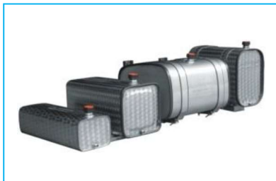
ACQUA ed OLIO